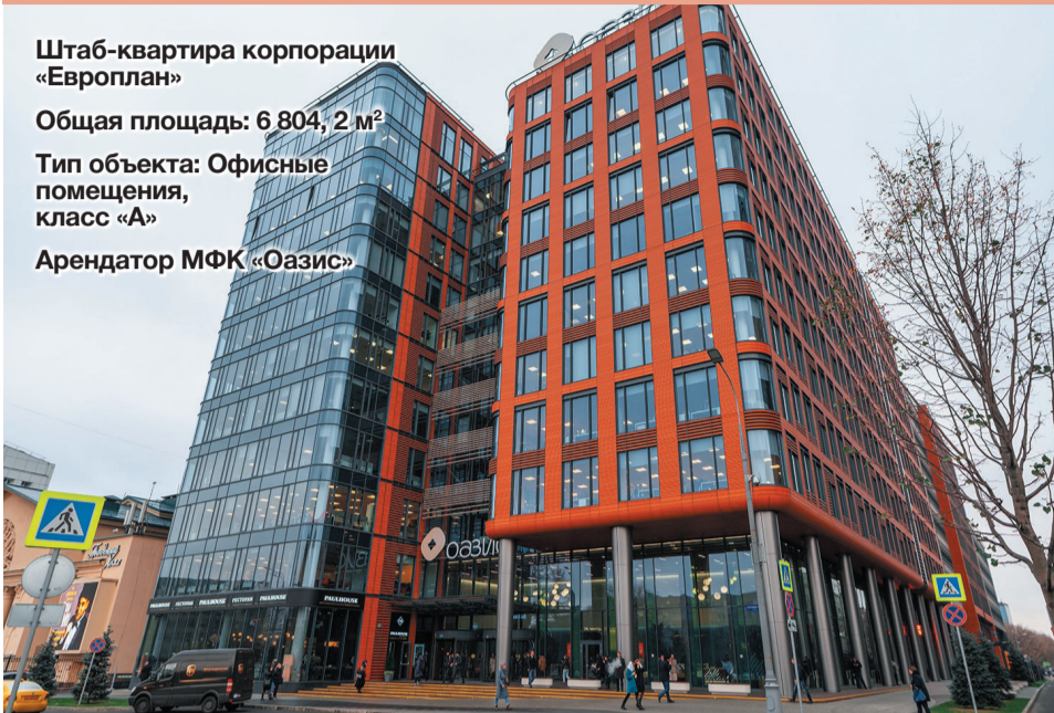
Штаб-квартира корпорации «Европлан» Общая площадь: 6 804, 2 м 2 Тип объекта: Офисные помещения, класс «А» Арендатор МФК «Оазис»