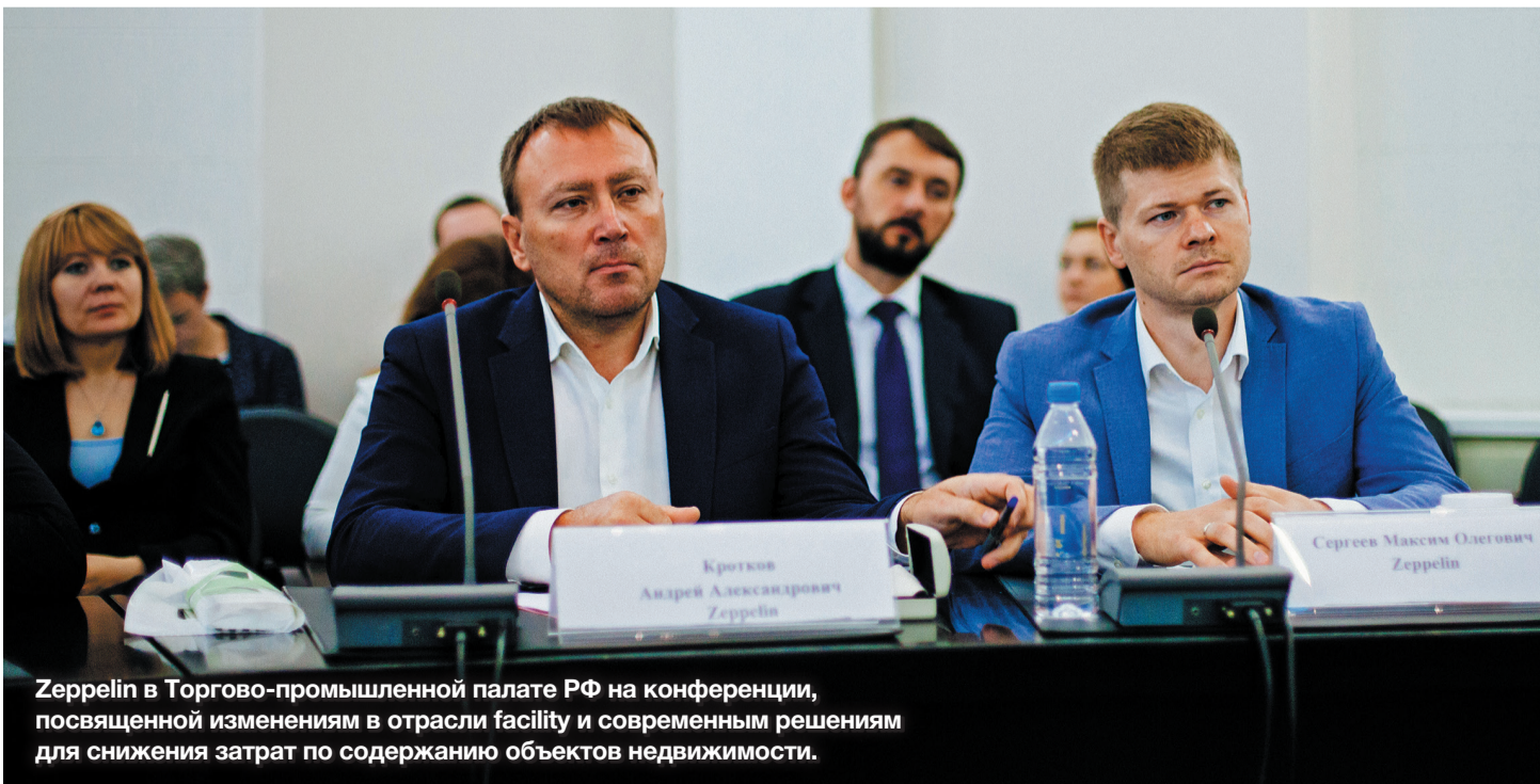
Zeppelin в Торгово-промышленной палате РФ на конференции, посвященной изменениям в отрасли facility и современным решениям для снижения затрат по содержанию объектов недвижимости.

*По материалам Property Guide, № 1, 2019